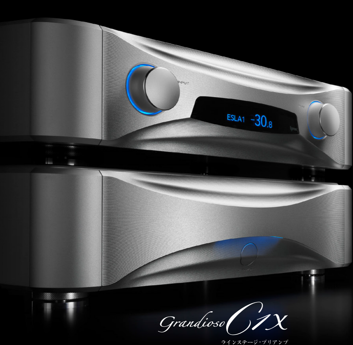
Grandioso C1X ラインステージ・プリアンプ

跟一般的電壓傳輸方式相比，因為能以大約100倍（最大值）的電流傳輸，所以不容易受到雜訊影響，也更能毫無保留地將音樂的能量送進後級。理論上來說，接駁線因為不受阻抗影響，所以從前級輸出的訊號和輸入後級的訊號可以保有極高的完整性。