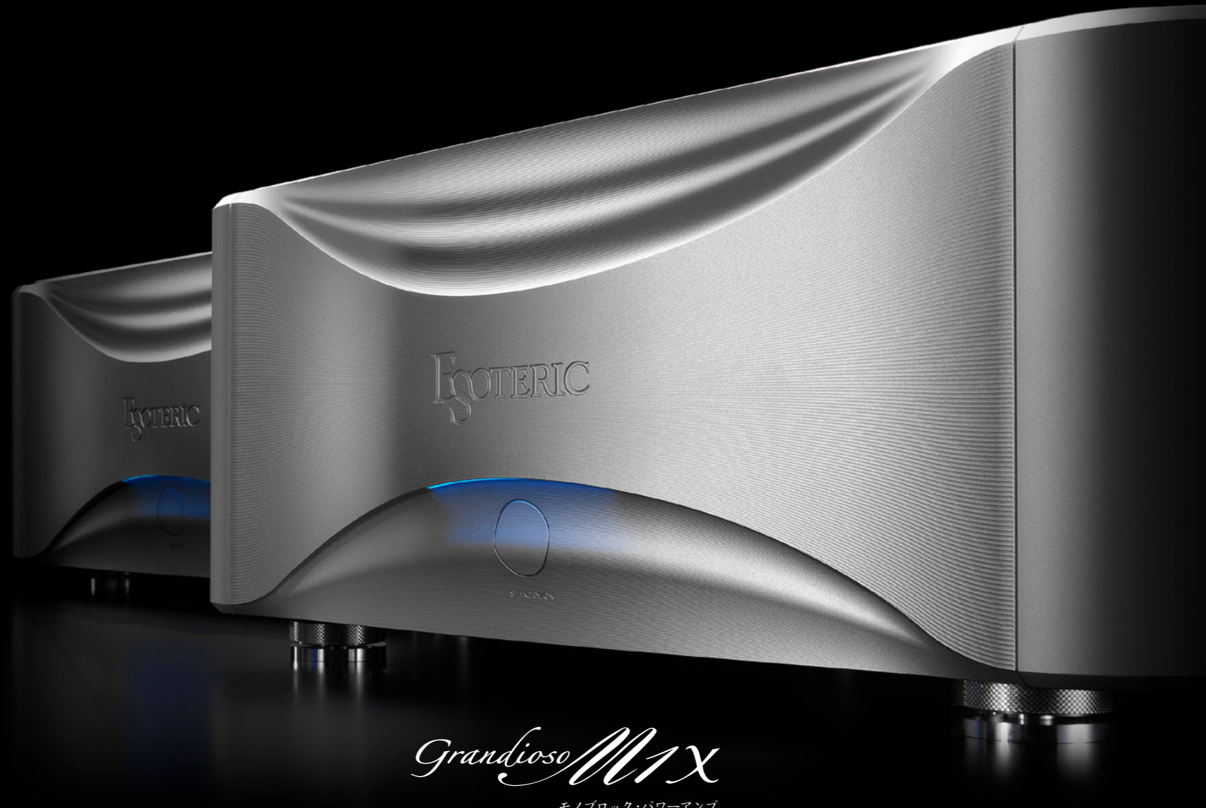
Grandioso M1X モノブロック・パワーアンプ