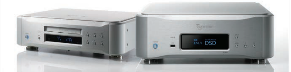
Super Audio CD Transport P-05X+N-01XD

到2,000V/ \mu s驚人高速的元件。對類比輸出電路來說，最重要的就是追求強力的電流傳輸能力和速度的極致，以及讓人屏息的動態範圍，藉此重現音樂的真實。作為緩衝電路電源的EDLC*2採用超級電容陣列，每聲道共具備250,000 \mu F的大容量，能穩定支撐低頻，讓音樂經由屏息的真實來重現動態。