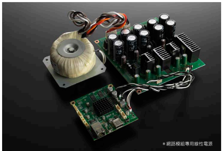
* 網路模組專用線性電源