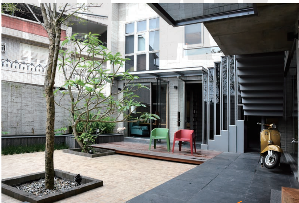
↑ 有人說空間就是最好的裝飾，這裡真的是印證了這樣的說法，猶如天井一般的內院採取簡約又巧妙的設計，給人一種開闊、舒服的質感。