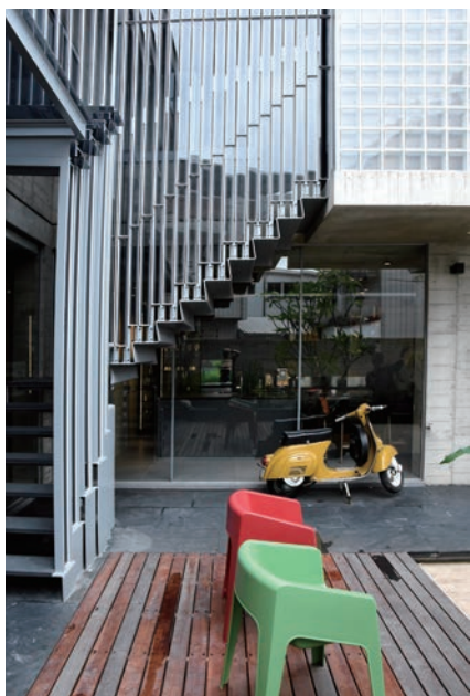
← 這是上二樓的樓梯，此處的設計費盡心思，不僅結構細密、造型好看，還能引入採光，並有透風、不悶熱等效果。