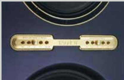
前障板裝備的電平調整部只要更換PIN就能夠以1.5dB為單位以5段(±3dB)調整同軸驅動器的號角驅動部(700Hz~17kHz)以及高音單元(17kHz~61kHz)的電平。

前面我記載說本機種的外觀沒有TANNOY那種威風凜凜的印象，聲音可能也未必適合用威風凜凜形容，不過這毫無疑問卻是TANNOY的聲音。這種聲音與象徵TANNOY聲音的Autograph所傳承的大型背載號角式發聲方法有關，而原型機Kingdom也已經解決這個問題。本機種與這種類型不同，而且原型機Kingdom是搭載大口徑超低音單元所以讓人聽到過去TANNOY SOUND從未有過的具有堅硬感和