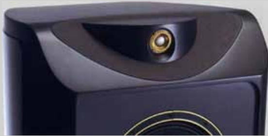
半球型高音單元採用進行過陶瓷電鍍的1吋口徑鎂合金製振膜，磁性回路搭載釹磁鐵，據說負責17kHz以上的頻帶，最高可延伸播放至61kHz。附註：這類高音單元考慮到音箱的干擾故收納在獨立的外殼Housing內，周圍貼有意大利軟皮革。