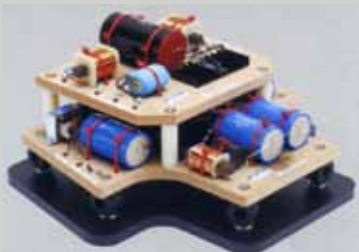
分頻網路採用TANNOY史上最大型基板，這是先分成低音專用與低音以上的頻帶專用二片再重疊起來的「雙層構造」的回路，再搭配上橡膠懸吊與黃銅懸吊(右下方的照片)使其懸浮在音箱底面藉以防止振動造成的音質劣化，還使用英國ICW公司的聚丙烯電容器等經過嚴選的零件，因此同軸單元，號角驅動器部分的阻抗匹配的並不是常常被使用的電阻，而是使用訂製的自耦變壓器，但是並沒有使用印刷基板，這些零件的配線則是用6N PCOCC的硬線，高音單元經過試聽測試的結果而選擇4N銀單線，分頻網路也實施了超冷處理。