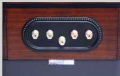
揚聲器端子是近年 TANNÖY 常見的中央裝備接地端子，而且支援雙線連接的端子，端子是 WBT 製，附送的 Jumper Pin 是 6N 銅製。