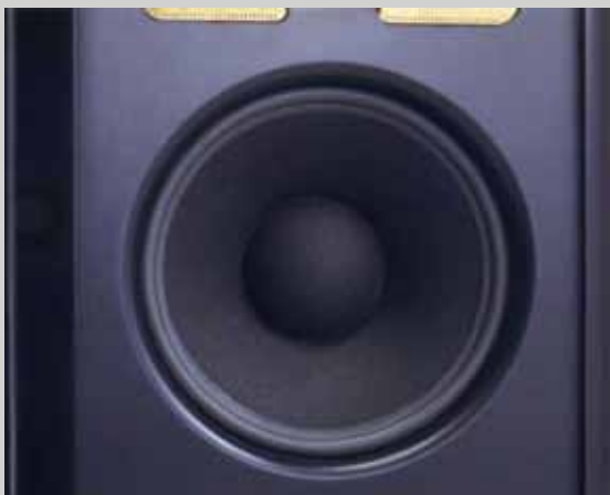
負責120Hz以下的15吋口徑錐型低音單元與中低音一樣採用Kurt Muller製的多種纖維紙質振膜，磁性回路也同樣採用鐵氧體磁鐵，音圈採用能夠經常在磁隙內動作的所謂的短音圈。長磁隙方式，這可說是高線性優先於大振幅的構造。