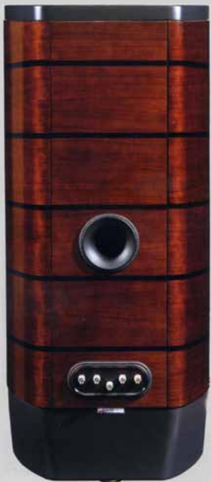
背面的胡桃木經過高光澤鋼琴烤漆，看起來很漂亮而吸引人，中心部分的低音反射孔是低音單元專用，音箱內部備有同軸單元專用的密閉式腔室，反射孔的調整頻率是 15Hz。附註：設置方式有兩種可以選擇，一種是在四個角落配置小腳輪，另一種是使用錐型鋁製腳部進行前方 2 點，後方 2 點的 3 點支撐方式。

根據資料，骨架部分、前障板、膠合板的組合活用了 TANNÖY 使用 DMT (素材差動技術) 製成的防振材，經由結合不同共振模式的素材能有效減低不必要的共振，