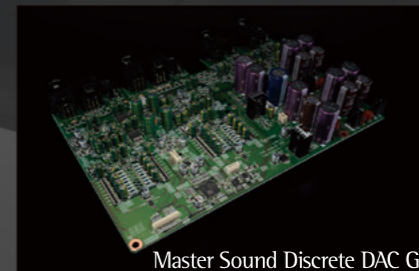
Master Sound Discrete DAC G2

N-05XE 是一款專為 以最小系統配置，提供最高音質 而設計的網路 DAC 前級擴大機。配備 支援光纖網路連接的 G4 網路引擎採用 次世代 G2 離散 DAC 繼承 Grandioso 系列直系血統的雙平衡前級（Dual Balance Preamp）設計內建 高性能耳機放大器XE 型號在保持廣受好評的功能性基礎上，對 所有電路元件進行全新設計與優化，進一步提升音質表現。