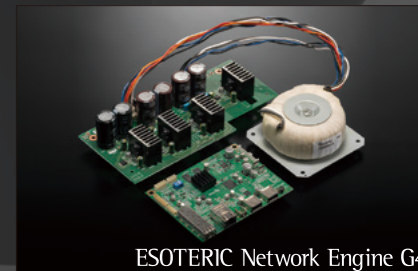
ESOTERIC Network Engine G4