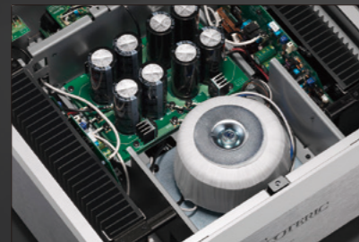
1,000VA 環形核心電源變壓器，採用雙單聲道電源濾波電路