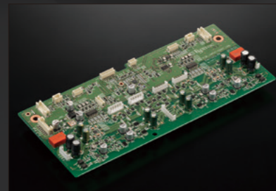
全新設計的完全對稱式平衡輸入緩衝放大電路